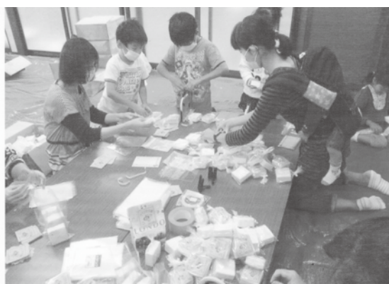
廃油石鹸袋詰め作業