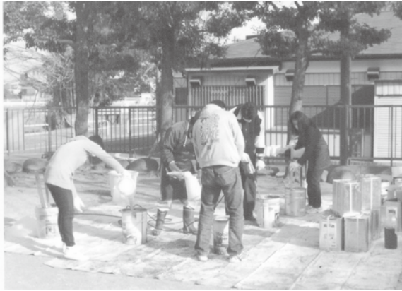
廃油石鹼原液づくり