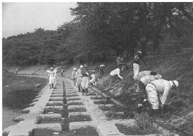
①②沢田地区全世帯で河川敷の草刈り、清掃