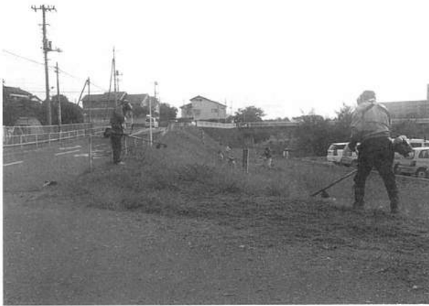
⑤⑥役員で堤防の草刈り、清掃