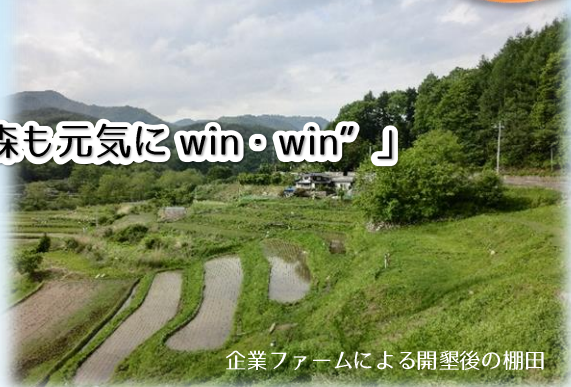
企業ファームによる開墾後の棚田