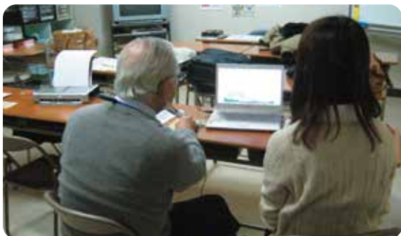
▲うちエコ診断の様子(昨年は30件の診断を実施しました)